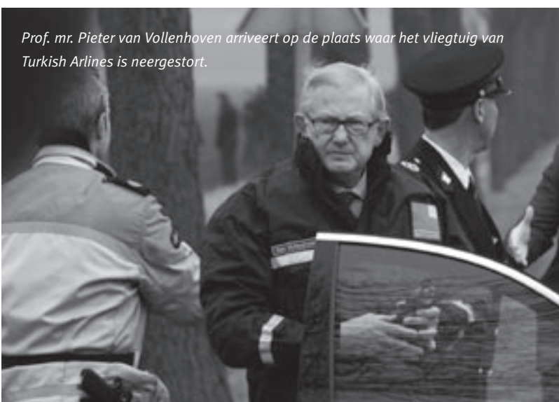
Prof. mr. Pieter van Vollenhoven arriveert op de plaats waar het vliegtuig van Turkish Airlines is neergestort.