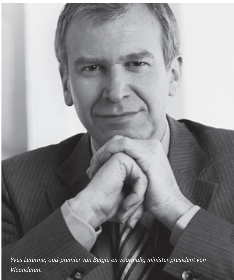
Yves Leterme, oud-premier van België en voormalig minister-president van Vlaanderen.

Deloitte en Stichting Atrium organiseren de Burgemeesterslezing; deze vindt plaats op woensdagavond 9 september 2009 in het Atrium van het Stadhuis in Den Haag. Indien u de burgemeesterslezing wilt bijwonen, kunt u zich vóór 29 augustus 2009 aanmelden via www.burgemeesterslezing.nl .