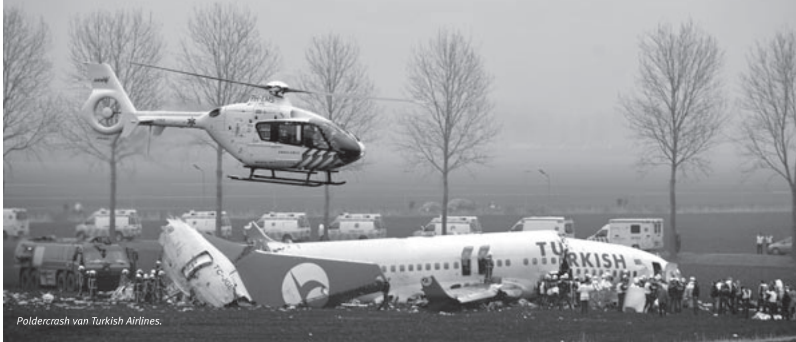
Poldercrash van Turkish Airlines.

waren gemaakt nádat was afgeschaald naar GRIP1 werden daarmee buiten beschouwing gelaten. 2 De gemeente moest uiteindelijk genoeg nemen met een rijksbijdrage van € 24.421,92. Een beroep daartegen strandde bij de Raad van State.