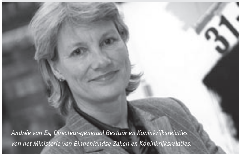
Andrée van Es, Directeur-generaal Bestuur en Koninkrijksrelaties van het Ministerie van Binnenlandse Zaken en Koninkrijksrelaties.

Het zomerreces staat voor de deur. Een tijd dat de dagelijkse winkelbel wat minder rinkelt en daarom ook bij uitstek een tijd om de balans op te maken over de voorbije periode. Want dat er woelige tijden geweest zijn, ook voor u als burgemeester, dat staat wel buiten kijf. Zo zijn er de Dijkstal-voorstellen, die ook van belang zijn voor uw rechtspositie. Vorig jaar al op de nominatie om door de Tweede Kamer behandeld te worden, maar in de toenmalige versie gestrand, omdat de ministerraad in deze tijd van economische crisis een verhoging van de salarissen van politieke ambtsdragers onwenselijk achtte. Daarmee is de manoeuvreerruimte van de minister om de Dijkstal-voorstellen voortvarend in te voeren, drastisch beperkt. Ik begrijp uw onvrede hierover; dit was niet wat u voor ogen had, toen afgesproken werd uw rechtspositie mee te nemen in de Dijkstal-adviezen. Momenteel proberen we de voorwaarden te creëren om toch verder te praten. We zijn bijvoorbeeld hard aan het nadenken over de huisvestingsproblematiek, waar een aantal van u tegenop loopt en over het realiseren van de overgang naar de APPA, zodat er geen verband meer hoeft te zijn tussen het recht op uitkering en de reden van vertrek.