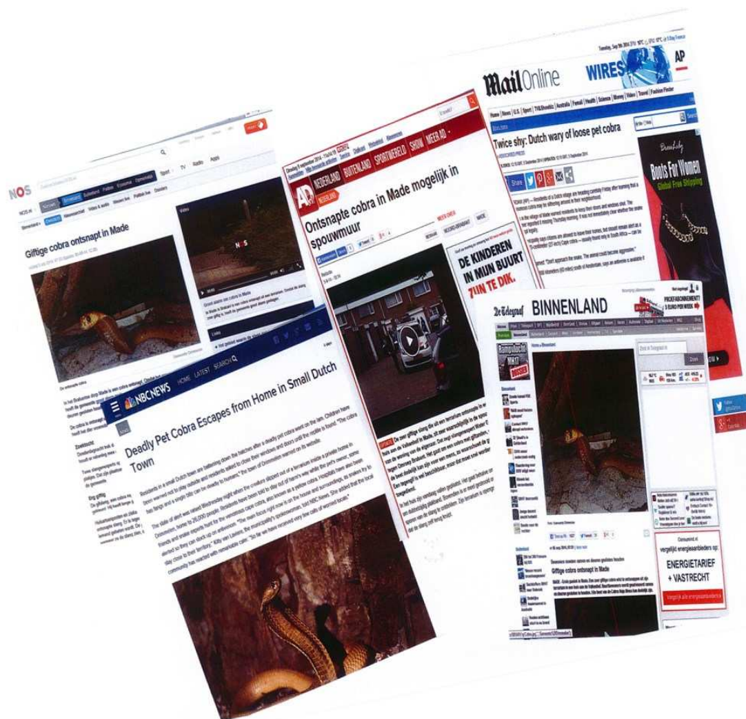
Afbeelding 1: compilatie van diverse persberichten op internet

Vanwege de privacy-gevoeligheid ontbreken in de publieke versie de bijlagen logboek en de rapportage van Serpo.