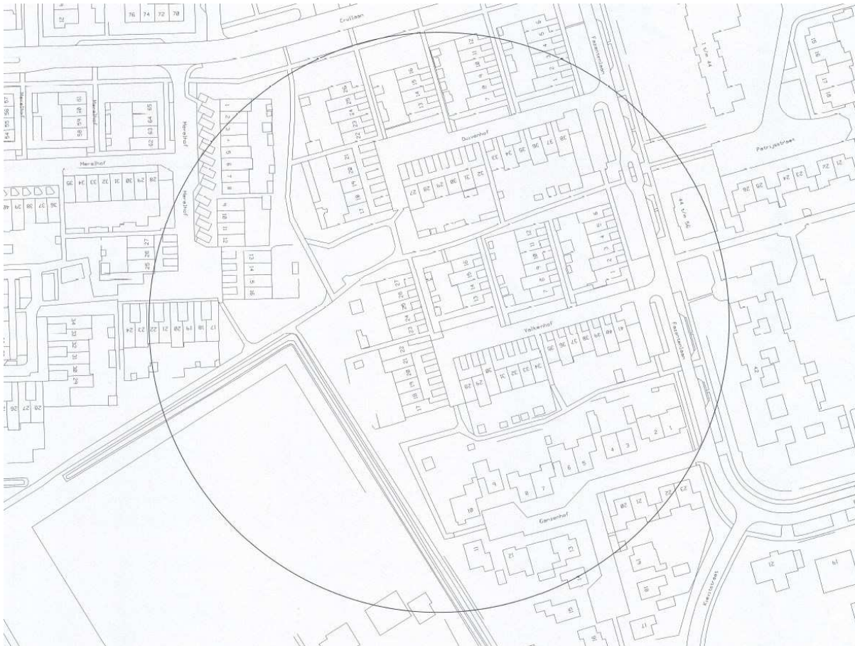
Afbeelding 2: cirkel die aangehouden is als mogelijk verblijfsgebied van de cobra